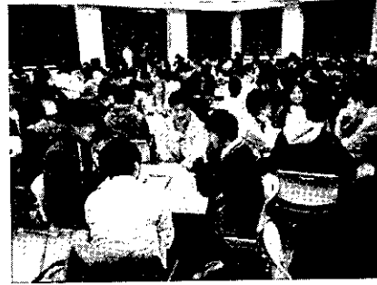
写真 1 授業の様子

LMS として Moodle を用いて、コース上に教材を載せていき、必要に応じて練習問題や、活用報告用データベース、レポート提出などを配置した。教材はいつでも読み返せるようにプリント(PDF)形式で、ID 理論などを解説したものである(図 1)。既存の ARCS モデルのヒント集では、教材づくり編(教える側)と学習者編(学ぶ側)の両方が存在することなどを参考に、特に ID 理論については教える側と学ぶ側の双方の視点から活用のヒントを並べて提示することで理解が深まるようにした。また、教材を事前に必読させ、授業はそれを前提にして、主にグループ活動を行う場とした。活用報告については、多くの報告に接することができるように、コース上で報告させて共有するようにし、合計で報告を 7 回行った。他者の報告を読み、気に入った報告に一言コメントをつけさせるようにした。