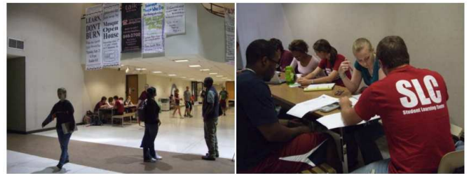
写真7と写真8 講義棟1階のロビーの一角で実施されているチュータリング

図2に、テキサスA&M大学取材で撮影した2枚の写真を示す。左は学生によるチュータリングが行われている場所が玄関ホールであることを示す。一方の右側は、学生チューターが学生学習センター (Student Learning Center) の頭文字を大きく描いたTシャツを着てその仕事にあたっている様子を示す。どちらも、学生によるチュータリング活動が行われていることを周知・広報するための工夫であるが、ホールでの開催は、施設が充実しなくても始められることを、またTシャツはチューター自身に誇りと責任感を持たせるための工夫でもあることが重要である。